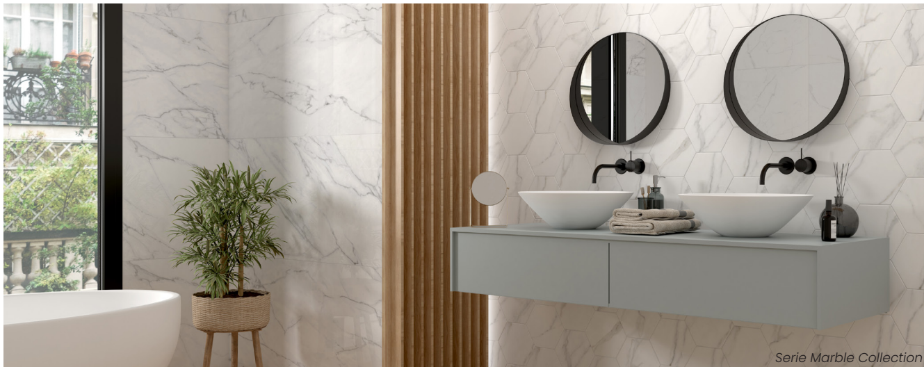
Serie Marble Collection