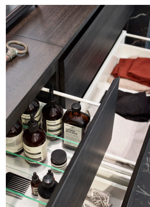
Bildserie från Vedum kök & bad.